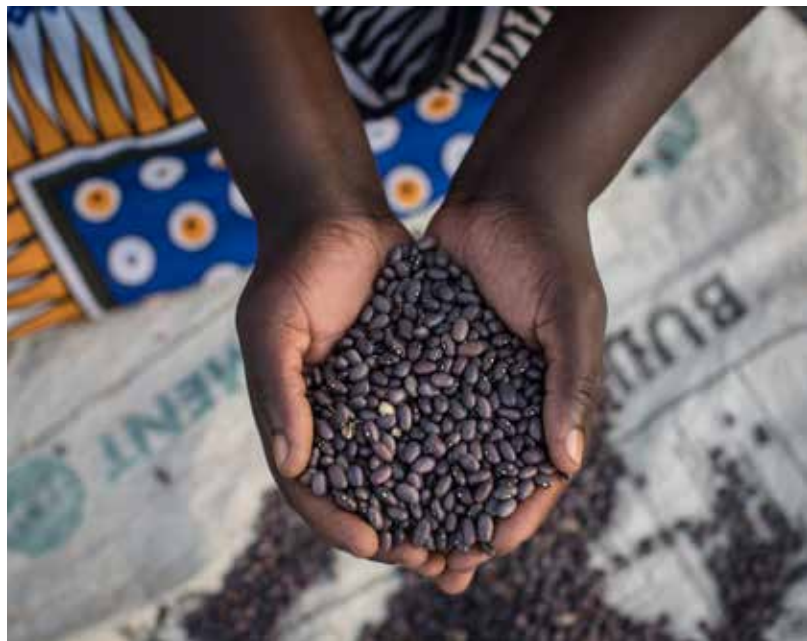
Une femme tient des haricots dans un marché de Homabay, au Kenya. Les haricots peuvent exiger un long temps de préparation, mais des milliers de femmes, au Kenya et en Ouganda, pourraient bientôt consacrer moins d'heures à la cuisine, grâce à des recherches financées par le CRDI visant la mise au point de produits à base de haricots précuits.

Il y a aussi des normes qui confinent les femmes dans des rôles particuliers en matière de production et d'attribution de la nourriture, ce qui peut les désavantager. Au Malawi et en Zambie, par exemple, on observe une séparation très claire des rôles dans le secteur des pêches. Les hommes vont à la pêche, et les femmes leur achètent le poisson pour le transformer et en faire le commerce. Mais cela crée un déséquilibre