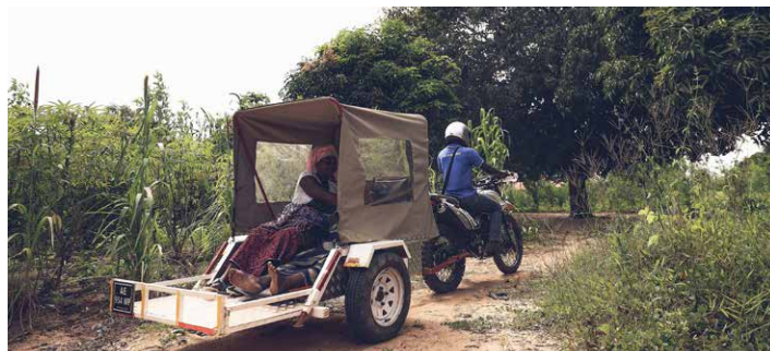
Une femme enceinte et une sage-femme traditionnelle dans une moto-ambulance pendant une simulation de transport à l'hôpital dans la province de Nampula au Mozambique.

Les habitants de Nampula ont choisi les conducteurs parmi les