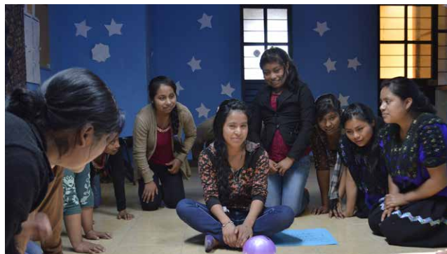
Des femmes répètent une pièce de théâtre intitulée Svayich Antsetik (rêve de femme) à San Cristóbal de Las Casas, dans l'État mexicain du Chiapas, en 2017.

Les assaillants peuvent être d'autres migrants, des trafiquants d'êtres humains connus sous le nom de « coyotes », des policiers,