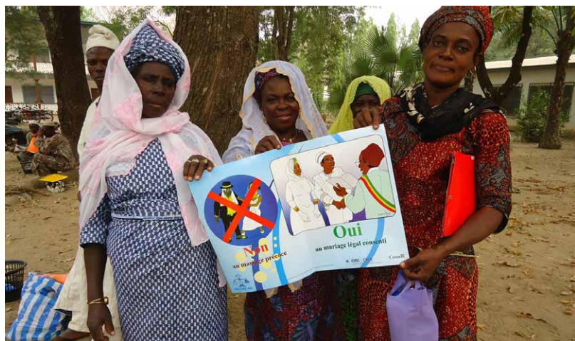
Trois femmes tiennent une affiche faisant la promotion du mariage civil, lors d'un forum sur le mariage des enfants avec des chefs traditionnels et religieux à Sokodé, au Togo.

Les résistances sont considérables, car le programme touche au cœur de la perception des femmes dans les collectivités. Selon les croyances traditionnelles, les femmes sont là pour servir les hommes, poursuit Mme Adjamagbo-Johnson. Plutôt qu'une affaire d'amour, le mariage est un accord entre deux familles qui